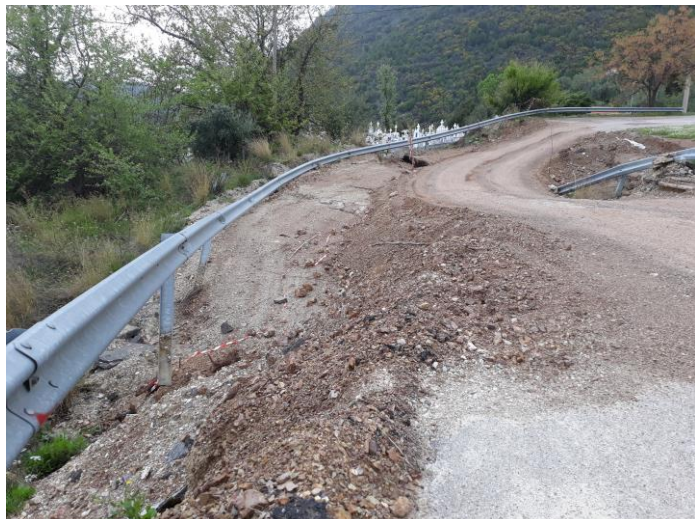
Η κατάσταση του δρόμου μετά τις βροχές