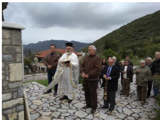
Τρισάγιο στο μνημείο του Φώτη Μισιχρόνη